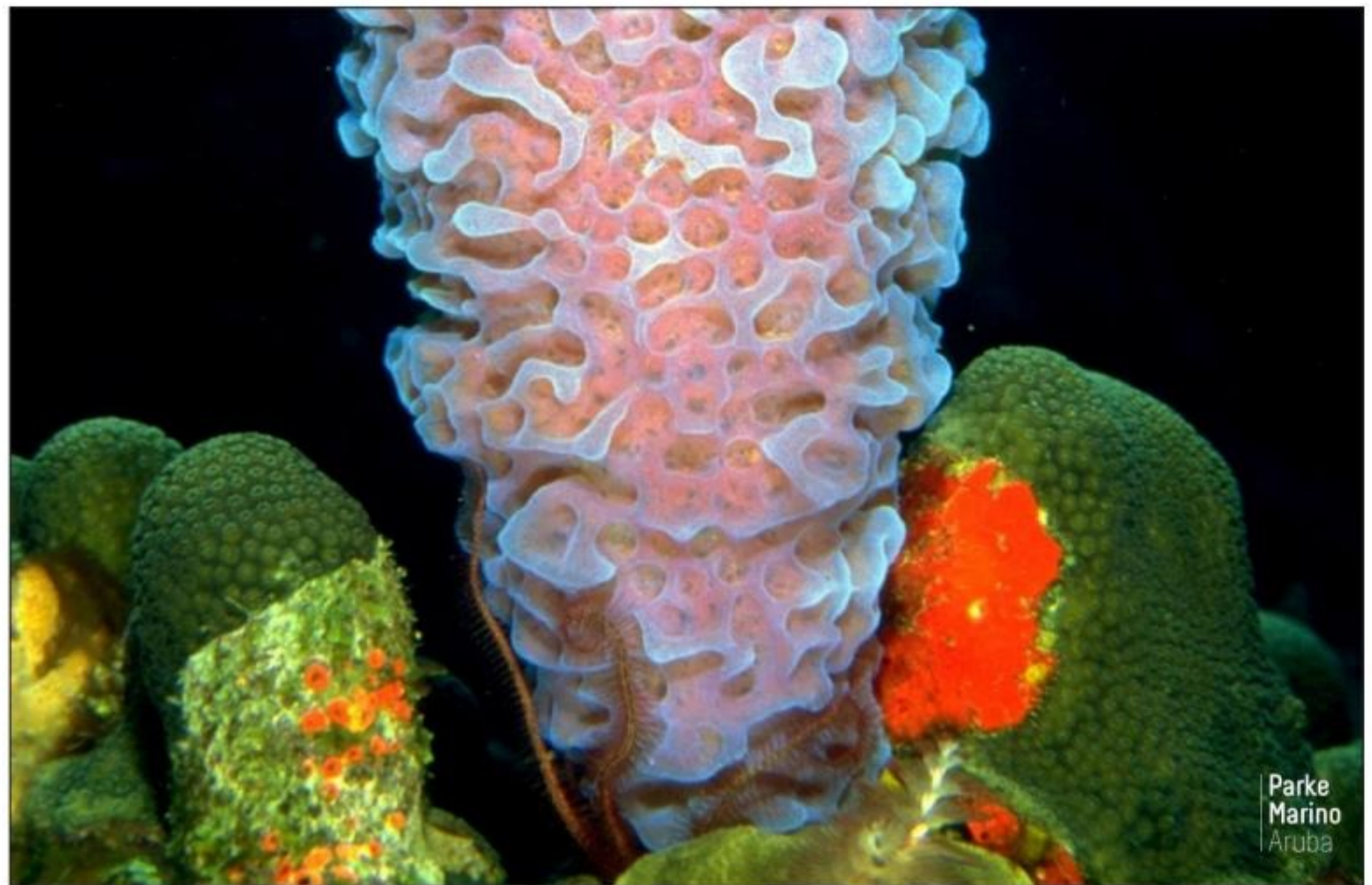
Parke Marino Aruba

E areanan cu lo cay bou di e parke marino a wordo asigna hopi tempo pasa ora expertonan a señala e